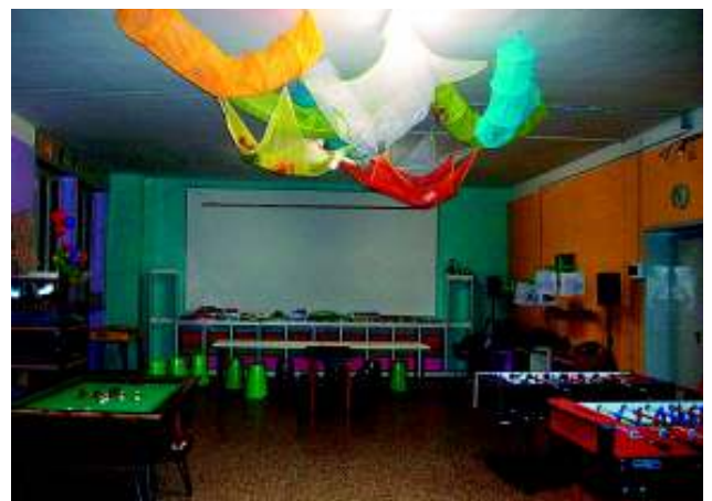
Sala giochi dell'Oratorio