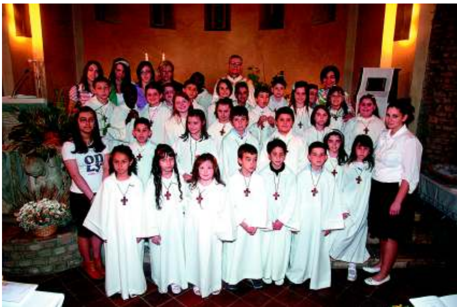
Il gruppo dei partecipanti alla Prima Comunione 2010 con i catechisti