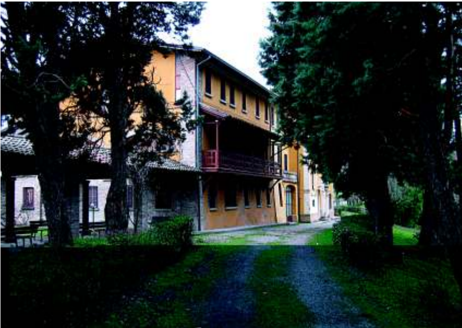
Villa Santa Maria