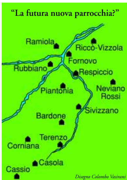
Disegno Colombo Vasirani