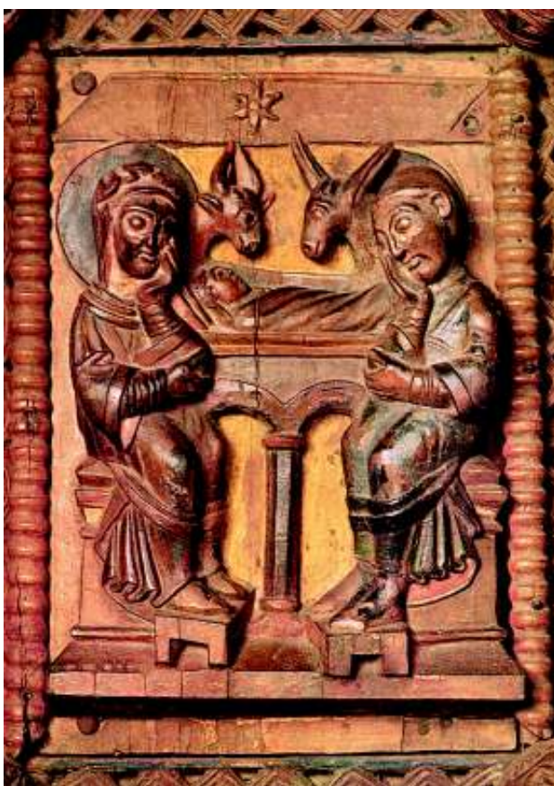
Particolare della Natività in stile romanico nella Chiesa di Santa Maria in Campidoglio a Colonia in Germania

Carissimi, nel bilancio di quest'anno, giunti ormai a farci gli auguri di Buon Natale, ci sediamo accanto al presepe e rivediamo, a mo' di pacchetti presso l'albero, le novità del mo-