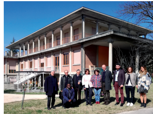
Visita alla scuola materna "Don Tarasconi"