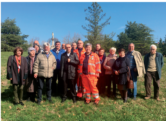
Rappresentanti del volontariato a Villa Santa Maria

Ore 9.30, il Vescovo arriva con la sua auto direttamente alla Villa Santa Maria, dove nel frattempo si sono radunati - qualcuno in una sgargiante divisa - rappresentanti del volontariato sia delle parrocchie che dei paesi. Ed è nella chiesetta della Villa che ci raccogliamo per il primo momento di preghiera, davanti all'immagine di Maria, dipinta dal compianto Don Alberto Tadè. Nell'incontro, il Vescovo fa notare come è bello aver iniziato la visita incontrando coloro che mettono a disposizione tempo, forze e competenze da dedicare al prossimo. L'atteggiamento del servizio, in parrocchia e nella società, dice senza tante parole lo spirito del dono di sé. Uno spirito che contrassegna in modo palese la cultura cristiana propria della nostra terra e condivisa da tanti, anche di altre culture. Alcuni interventi degli invitati, concisi ma sentiti, mettono in risalto la positività e l'incoraggiamento che si riceve da questa visita.