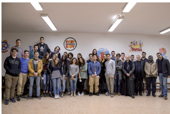
Gruppo giovani - Oratorio di Fornovo