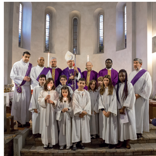
Alle 10, S. Messa e assemblea conclusiva.